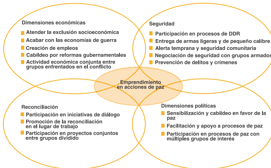
Figura 3 - Emprendimiento en acciones de paz ejemplos de intervenciones

Fuente: Adaptado de Smith, D. (2004), Towards a Strategic Framework for Peacebuilding: Getting their Act Together (Oslo, Noruega, Ministerio Real de Relaciones Exteriores de Noruega).