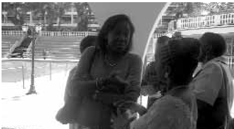
Participant es discutant de la voie à suivre