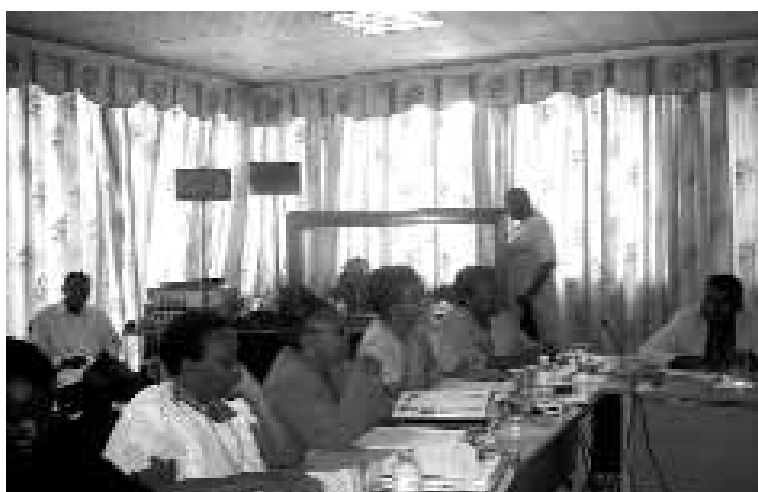
Participantes à des discussions en plénière