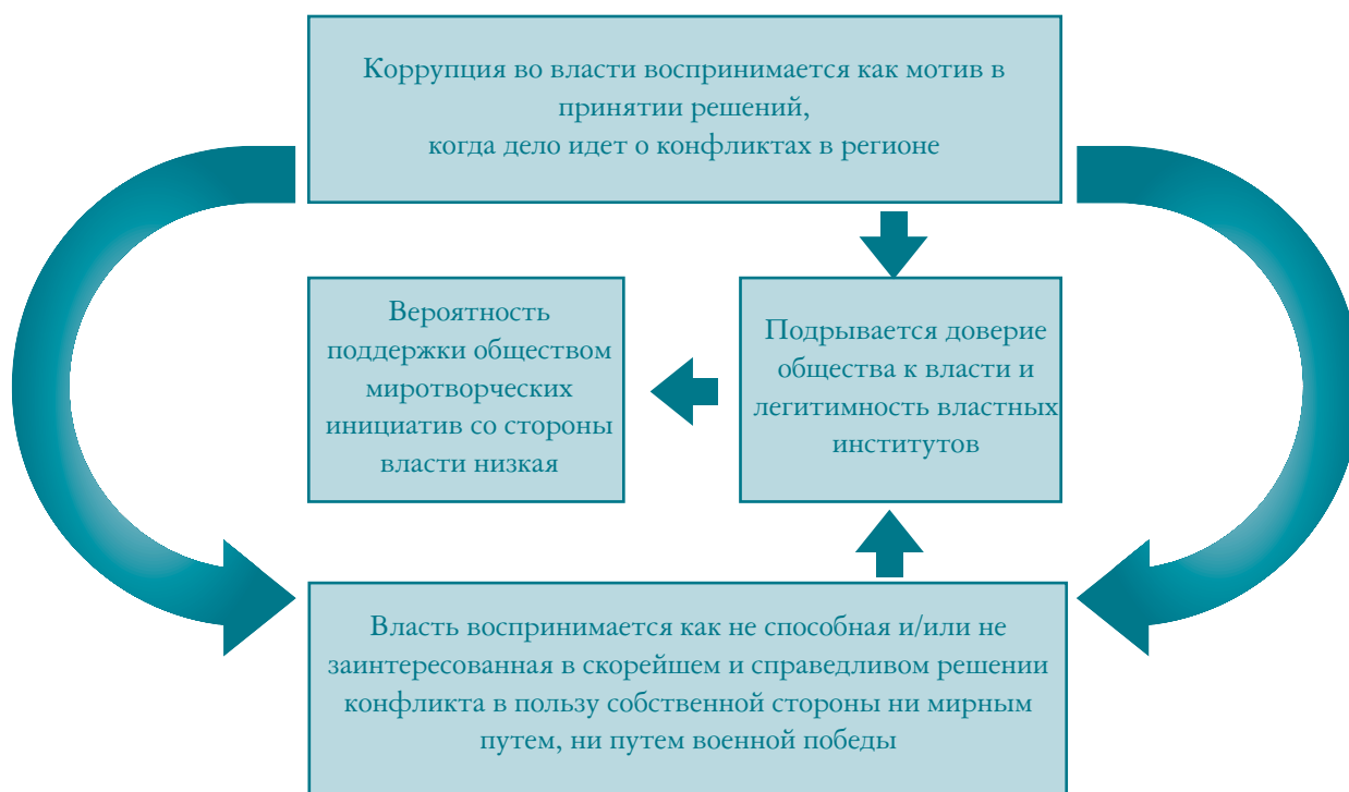
Рис. 2. Коррупция и легитимность мирного процесса на правительственном уровне

Правительство не может долго и успешно оправдывать тяжелые условия жизни народа кознями противника или третьих сторон, а самому тем временем получать прибыль от политики, основанной на коррупции, без того, чтобы не начать устанавливать авторитарную власть и применять политические репрессии. Однако это скользкая дорога, потому что в результате слабнут связи с собственным обществом и преданность главной цели в конфликте снижается, и начинается внутривластная борьба.