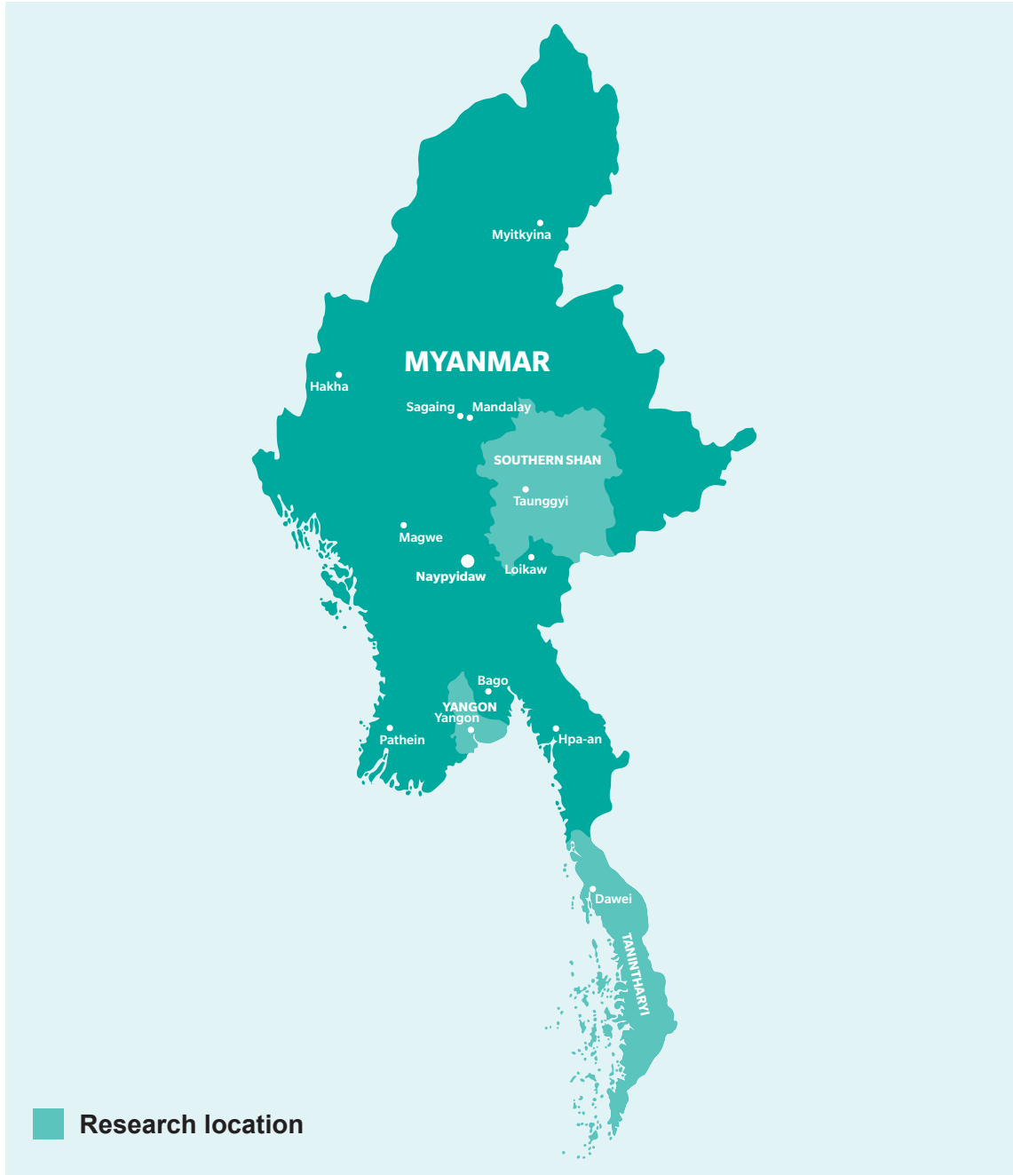
မြေပုံ ၁ - သုတေသနဆောင်ရွက်ခဲ့သည့် နေရာများ